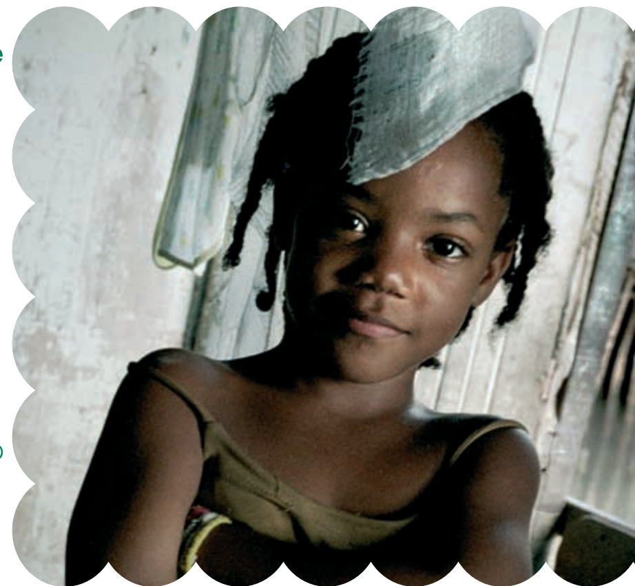
Emergenza Brasile

7 febbraio a Bologna >> clicca sul titolo che ti interessa per sfogliare velocemente la newsletter