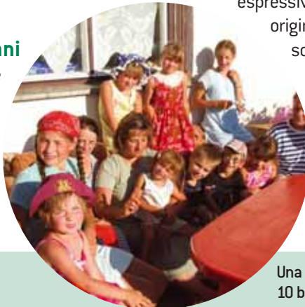
Una famiglia adottiva in Lituania: 10 bambini sono in affido.

espressive. Il sostegno alle famiglie di origine dei minori, siano essi a rischio di abbandono o in istituto, procede con regolarità e arriva a sostenere oltre 70 famiglie. Parallelamente, procede la ricerca, la selezione e la formazione di famiglie disponibili all'accoglienza, siano esse affidatarie o adottive.