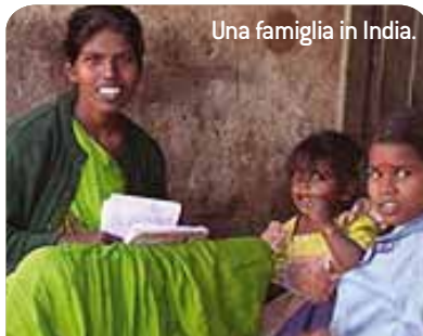
Una famiglia in India.

nella provincia di Surat Thani AVSI aiuta negli studi una trentina di ragazzi poveri e con problemi di malnutrizione. Nello Sri Lanka a Batticaloa, AVSI sup-