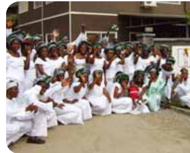
NIGERIA, Lo staff della clinica St. Kizito a Lagos.