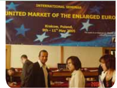
Un momento del seminario in Polonia.

Fondamentale è stato però non solo trasmettere dati e informazioni, ma soprattutto stimolare un confronto di esperienze e favorire la formazione di una rete informale tra i partecipanti che permetta loro di continuare la collaborazione una volta tornati nei propri Paesi. All'evento hanno preso parte una sessantina di partecipanti, in rappresentanza di consorzi, associazioni e organizzazioni di imprenditori provenienti da 5 nuovi Stati membri dell'Europa: oltre ai padroni di casa polacchi, erano presenti ospiti dall'Ungheria, dalla Repubblica Ceca, dalla Lituania e dalla Lettonia, mentre, tra gli altri, hanno accettato l'invito a intervenire alla conferenza l'ex primo ministro lettone, Valdis Birkvas; il responsabile del Directorate Generale per le Politiche Regionali della Commissione Europea, Jack Engweggen; Antonello Pezzini, consigliere del Comitato Economico e Sociale Europeo ed Enrico Biscaglia, direttore generale della CdO (Paola Caruso, AVSI Polonia).